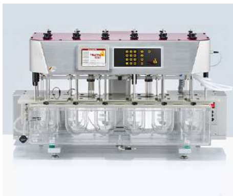
PTWS D620 6+6杯位双电机溶出仪