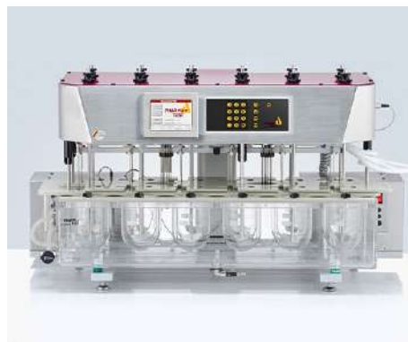
PTWS 1220 6+6杯位溶出仪