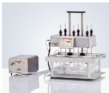
PTWS 120S 6杯位溶出仪 带独立转速