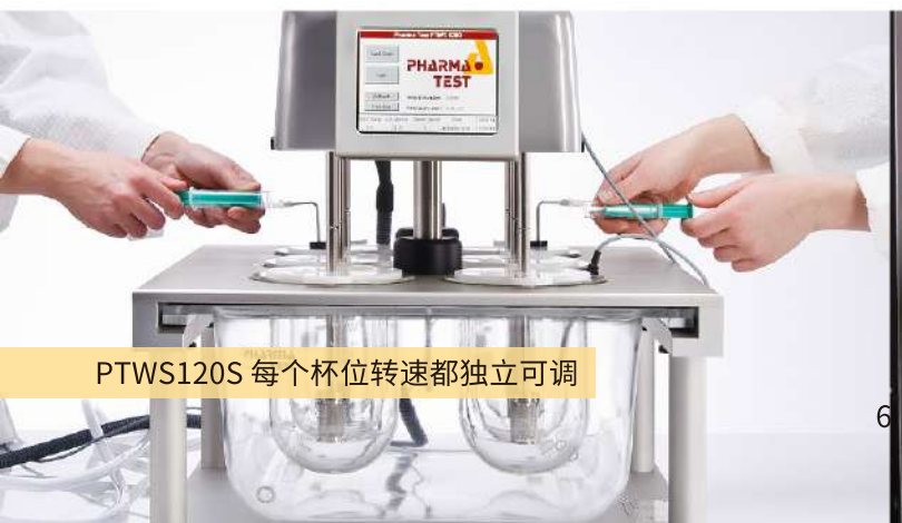
PTWS120S 每个杯位转速都独立可调