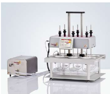
PTWS 820D 8杯位溶出仪