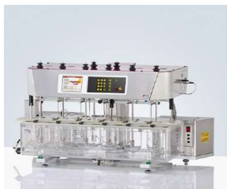
PTWS 620 6+2杯位溶出仪