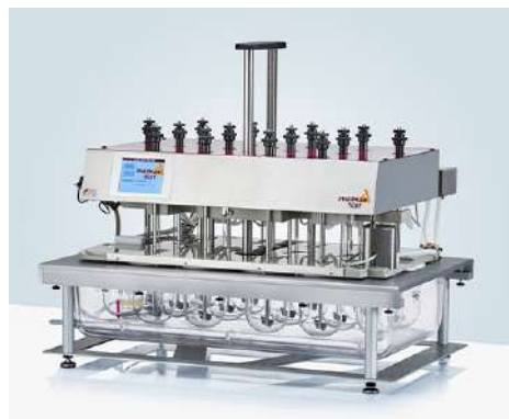
PTWS 1420 14杯位溶出仪